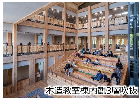
木造教室棟内観3層吹抜