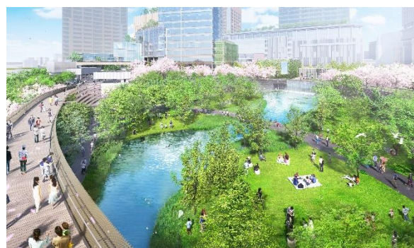
うめきた公園ノースパーク