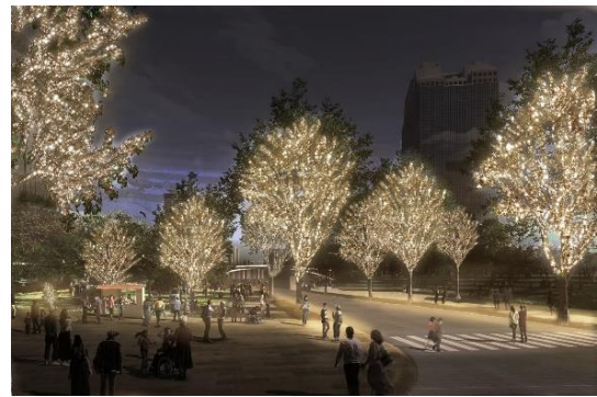
▲「Champagne Gold Illumination」過去開催時(グランフロント大阪・うめきた広場)